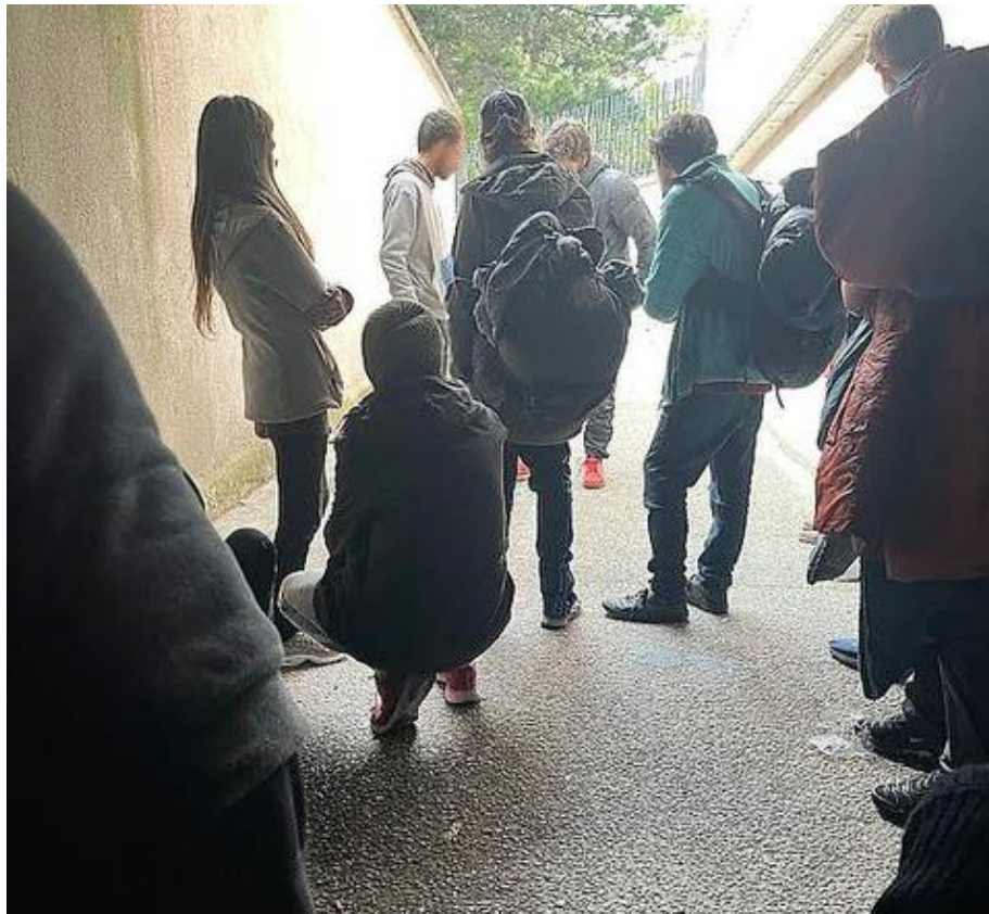
Point de deal sur une voie en descente qui mène à un parking sous-terrain condamné, à Lille.