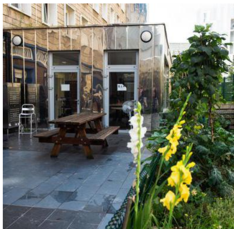
Ellipse, de l'association La Sauvegarde du Nord, est l'un des centres d'accueil et d'accompagnement à la réduction des risques pour usagers de drogue de Lille.

Nous avons poussé la porte de l'accueil de jour Ellipse, de l'association La Sauvegarde du Nord. Comme celui de Spiritek, de l'ABEJ solidarité, ou encore celui de CedrAgir, c'est l'un des centres d'accueil et d'accompagnement à la réduction des risques pour usagers de drogue de Lille (CAARUD). Un lieu d'accueil, d'aide et d'écoute.