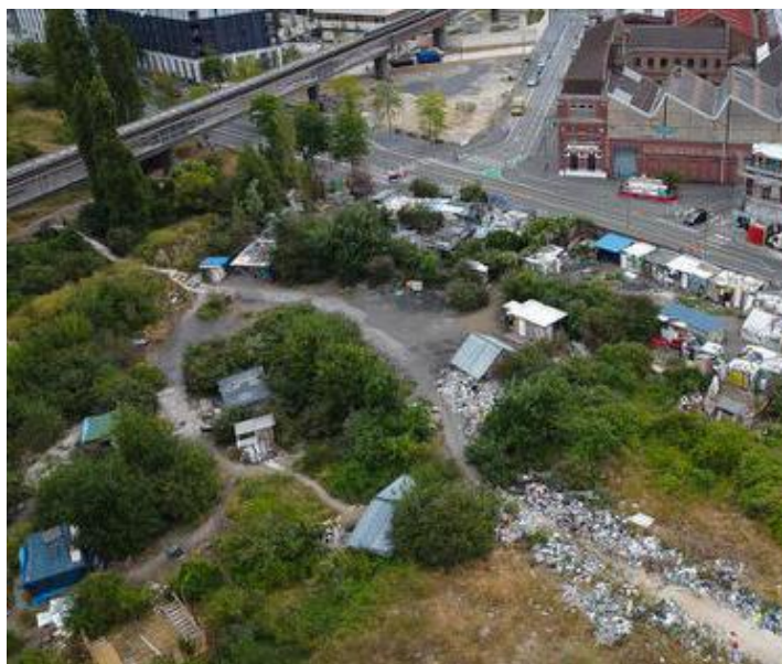
S'il n'y a pas à Lille de gros rassemblement de consommateurs, un point inquiète cependant et il est l'objet de toutes les attentions : la zone de la friche Saint-Sauveur, côté porte de Valenciennes.

Les consommateurs lillois fument le crack « dans tous les quartiers » disent les professionnels de la prévention et les éducateurs de rue, ce que notre enquête sur le terrain a confirmé. À domicile pour les mieux insérés, dans les halls d'immeuble, dans les stations de métro, sous les ponts, dans la rue ou dans les