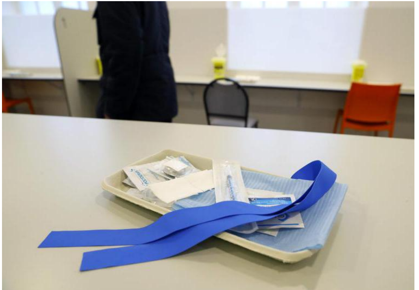
La première salle de consommation à moindre risque a ouvert en octobre 2016 dans le X e arrondissement de Paris.

Depuis 2016, la loi permet, à titre expérimental, la création d'un lieu de consommation de drogue très encadré. Martine Aubry, maire de Lille, a très vite manifesté sa volonté d'ouvrir une salle à Lille. Elle l'inscrit dans son programme de campagne municipale, en 2020. Le dossier est monté dès l'automne 2020.