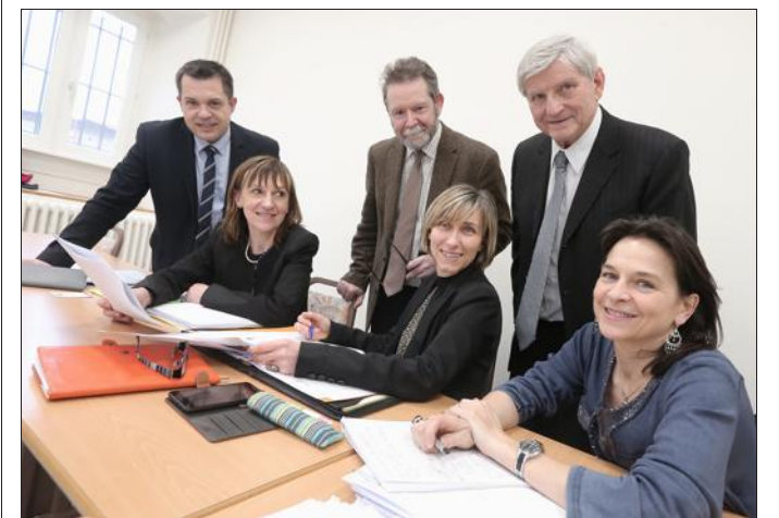
Le rectorat de Besançon, la fondation Varenne, le Medef, la CCI et l'Est Républicain s'unissent pour mener à bien ce projet pédagogique.